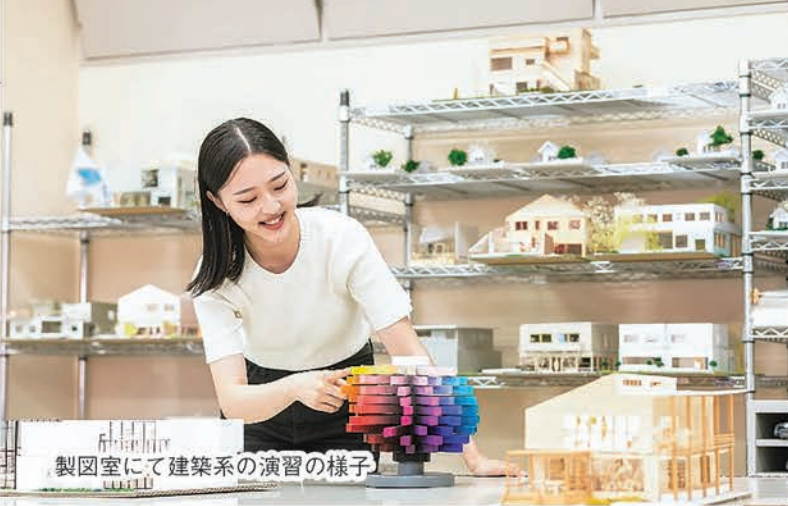
製図室にて建築系の演習の様子