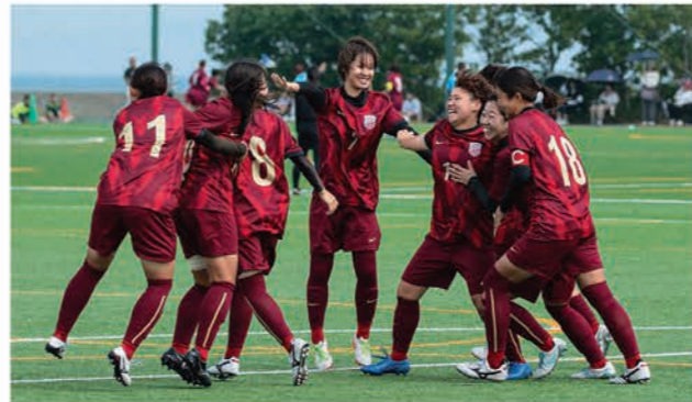
サッカー部 / 「大会2連覇」第33回九州大学女子サッカー選手権大会の様子