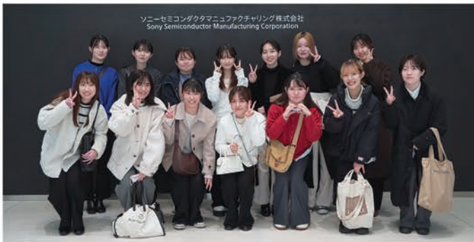
2023年度の企業訪問（グローバル企業を知る） ソニーセミコンダクタマニュファクチャリング株式会社長崎 TEC（諫早市） スマホの目であるイメージセンサーの最先端製造ラインを見学させていただきました

国際文化学科は活水女子大学の中で最も文系色の強い学科です。一口に「文系」といっても、大きくは「人文系」と「社会科学系」のふたつに分かれ、私が所属している「地域・ビジネスコース」は社会科学系の学問を主に学ぶコースです。今回は、担当している科目から「グロー