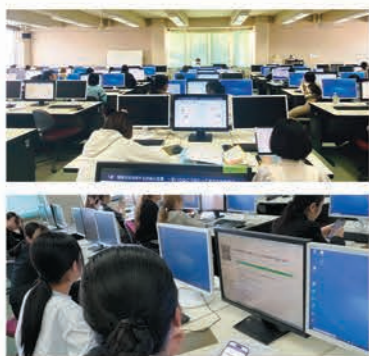
データサイエンス入門の授業画面 アプリを使って、みんなが双方向のやり取りを行なっています

取り入れ、自分も顧客やファンである企業がどのような戦略でグローバル企業として成長してきたのかをディスカッションします。また、年度によっては海外ビジネスを展開する県内企業を訪問することもあります。訪問は、県内に拠点を持つ「D&D（企業同士でのビジネス）」で、かつ、理工系学生に人気の企業に受け入れをお願いしています。就職活動時にD&D（消費者向けビジネス）以外の企業にも目を向けてくれること、教員志望者には未来の生徒からの進路相談へのヒントになることを期待しています。「データサイエンス入門」は今年度より教養教育の必修としてスタートした科目です。この授業では、データサイエンスやAI技術の概要をしっかりと理解することで、これらを不必要に恐れることなく「使いこなす側」になることを目指しています。学生たちの多くが「文系だからデータやパソコンを使うことは苦手」と思い込んでいます。そこで、重要なのはプログラミングなどの「処理」ではなく、目的に合わせてデータや分析方法を「選ぶ」こと、結果をもとに「何をするかを決める」こと、を強調しています。授業では「Slide」というアプリを用いて、