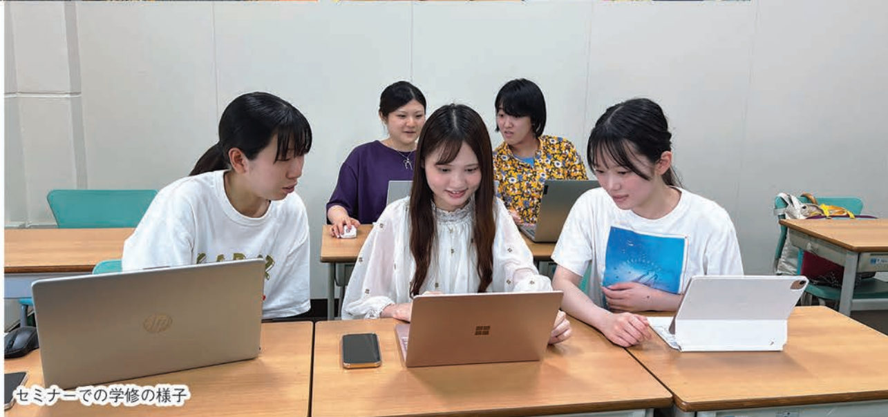
セミナーでの学修の様子