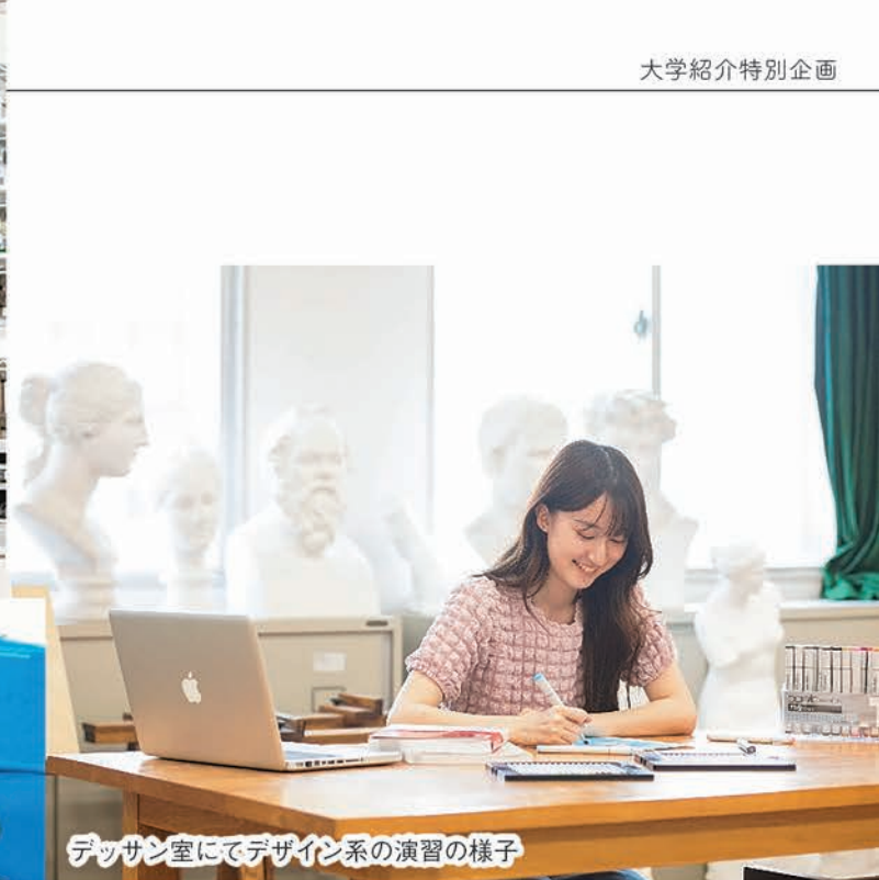
デッサン室にてデザイン系の演習の様子