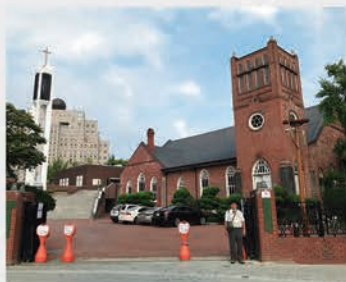
韓国最初（1885年）のプロテスタント教会であるソウル貞洞第一教会。1897年のチャペル献堂祝いに説教台と椅子を贈呈。（8月に訪問）