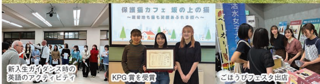
新入生ガイダンス時の英語のアクティビティ