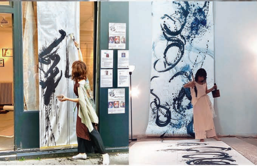
パフォーマンス (フランス)