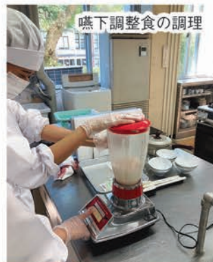
嚥下調整食の調理