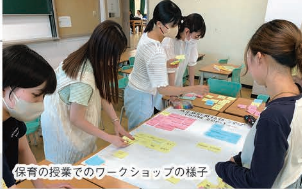
保育の授業でのワークショップの様子