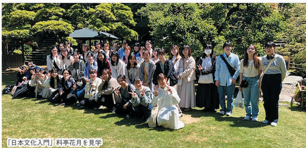
【日本文化入門】料亭花月を見学