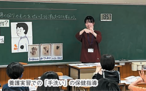
養護実習での「手洗い」の保健指導