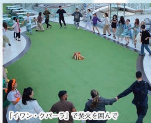
「イワン・クパーラ」で焚火を囲んで

また、ウクライナユースとして乗船していた子たちと仲良くなりたくさんの伝統文化を体験することができました。その中でウクライナの伝統の祭り「イワン・クパーラ」で焚火を囲んで踊ったのが楽しかったです。ウクライナの友達ができ実際に話を聞くと今起きているウクライナ侵攻がより身近なことに感じて今の自分にできることは何か考えることができました。