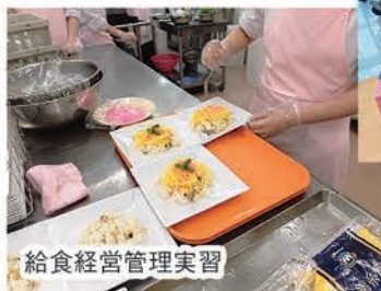
給食経営管理実習