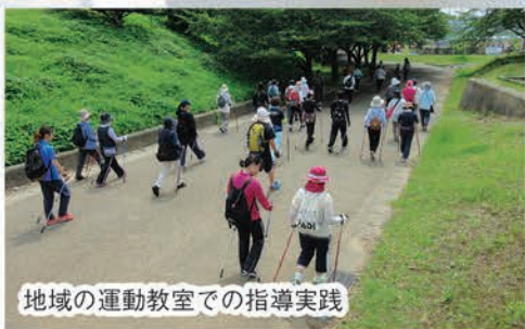
地域の運動教室での指導実践