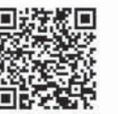
紙芝居 「わたしからあなたへ」