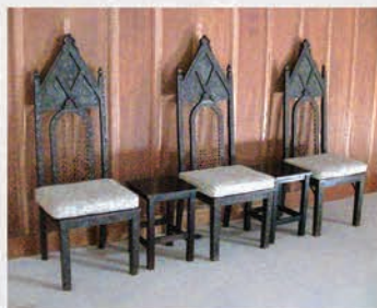
活水女子大学大チャペルステージの椅子。1892年、高等科2回生8名が卒業記念に神学科美術部へ注文した物。札幌とソウルにも同じ物が説教台と共に贈られました。