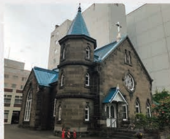
1889年創立の「札幌美以（メソヂスト）教会」に始まる日本キリスト教団札幌教会。焼失したチャペルを1904年12月に再建。その献堂式に向けて活水から説教台と椅子を贈呈。（6月に訪問）