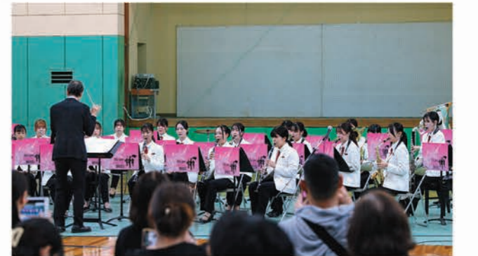
吹奏楽部 / 「定期演奏会」第140回 蜚雪会での演奏の様子