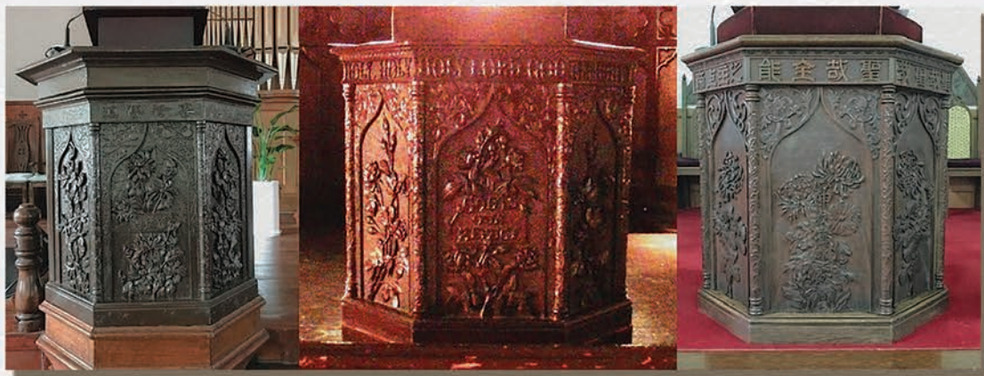
左：大韓民国ソウル・貞洞第一（ジョンドンジェイル）教会の説教台（1897 / 明治30年作製・寄贈）上辺に「専務傳道（専務伝道）」（新約聖書使徒言行録6章4節）、中央に「信望愛」（新約聖書コリントの信徒への手紙I 13章13節） 中央：活水女子大学小チャペルの説教台（1892 / 明治25年頃作製）上辺に「HOLY HOLY HOLY LORD GOD ALMIGHTY」（旧約聖書イザヤ書6章3節）、中央に「GOD IS OUR REFUGE」（旧約聖書詩編46篇1節） 右：日本キリスト教団札幌教会の説教台（1904 / 明治37年作製・寄贈）上辺に「聖哉聖哉 聖哉全能 之主上帝」（旧約聖書イザヤ書6章3節）、中央に「神我憐避處（かみはわれらのさけどころ）」（旧約聖書詩編46篇1節） （*横浜の教会へも1897年に贈られましたが、残念ながら1923年の関東大震災で失われています。）

（撮影・文：中学・高校社会科教師 山口 真樹人） ※製作者名、聖句や絵柄の由来、運搬のルートと責任者、横浜に贈られたものなどは、只今調査中です！