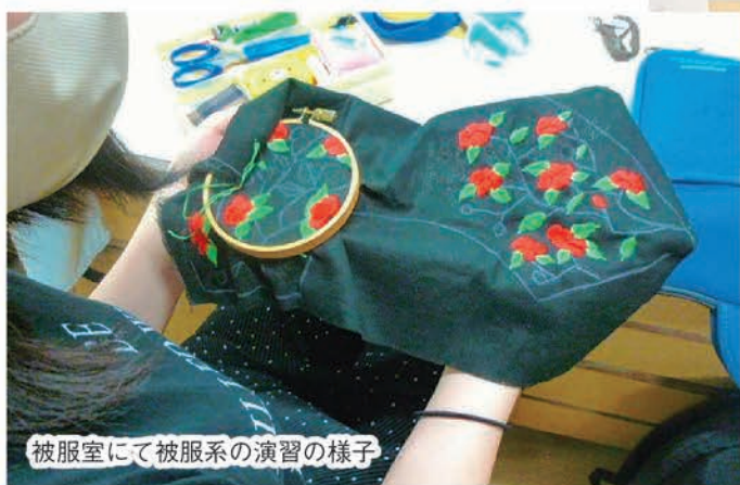
被服室にて被服系の演習の様子